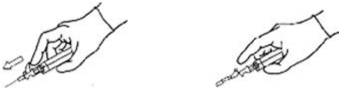
Активувати після ін’єкції

Негайно після виведення голки з тіла пацієнта активуйте пристрій для захисту голки, надавлюючи плече важеля вперед до упору, поки кінчик голки не буде повністю закритий (див. мал. 2).